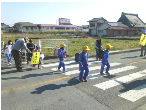
朝の登校の見守り