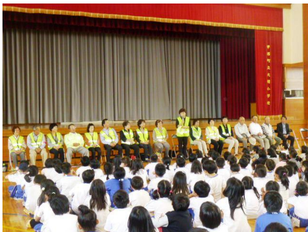
登下校ボランティア紹介式