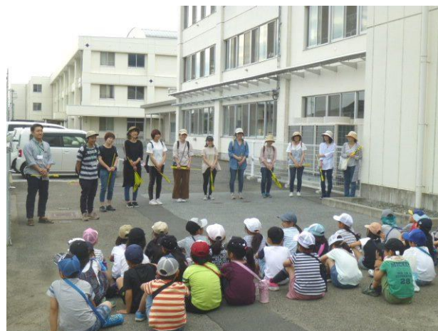
2年生校外学習付き添い